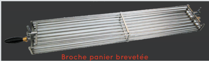
Broche panier brevet e