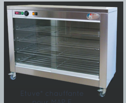
Etuve* chauffante pour MAP E