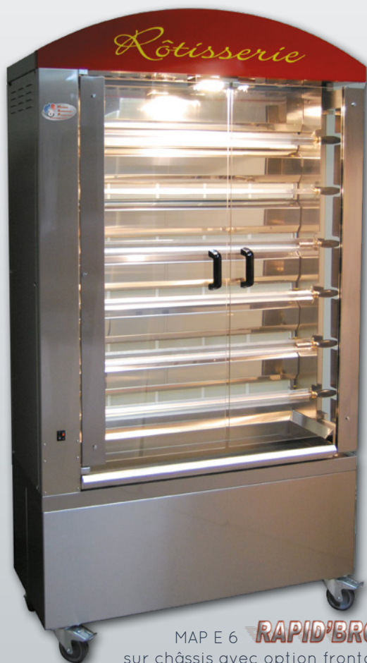
MAP E 6 RAPID'BROCHE® sur châssis avec option fronton "Rôtisserie"