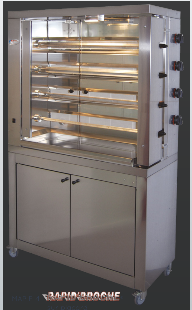
MAP E 4 RAPID'BROCHE sur placard